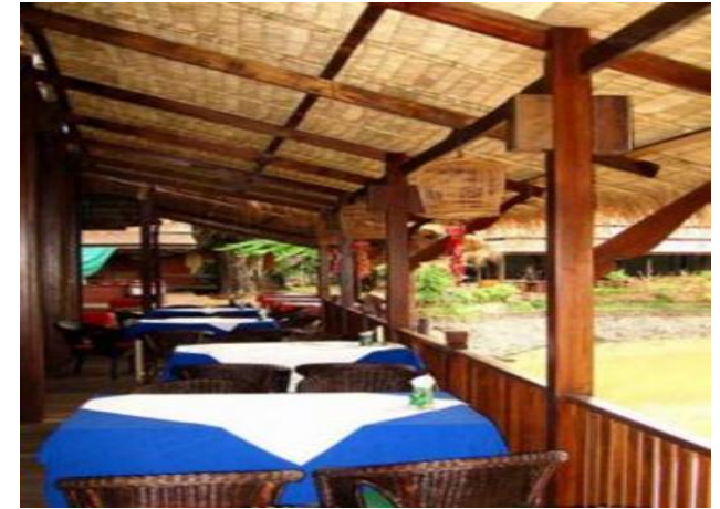
CHIANG RAI : Teak Garden